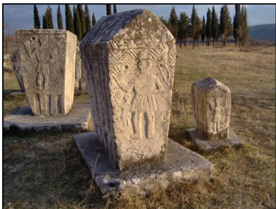
Sl. 1. „Vojvodske figure“, na dva sljemenaka i jednom sanduku ukrašene su figurama s uzdignutom rukom, velikom šakom i prstima. Ovi ukrasi postali su svojevrsni zaštitni znak nekropole Radimlja kod Stoca i stećaka u Bosni i Hercegovini.

Sve općine u Bosni i Hercegovini, sa izuzetkom sedam sjevernih graničnih općina, u svojim granicama posjeduju stećke. Na teritoriji naše države do sada je evidentirano 2612 lokaliteta sa stećcima, sa ukupno 58547 pojedinačnih spomenika. Najviše je stećaka u obliku sanduka (37312), zatim ploča (12734), sljemenaka (5437), stubova (2466), krstača (305) i amorfnih stećaka (293) (Š. Bešliagić, 1971.). Analizom tabele 1. jednostavno se da zaključiti da su stećci, kao nadgrobni spomenici, najkarakterističniji za područje srednjovjekovne bosanske države. Ovi specifični kulturno-historijski spomenici u svijetu se jedino mogu sresti u našim krajevima. Otuda i potiče mogućnost crpljenja turističke atrakcije i mogućnosti valorizacije za razvoj, prevashodno, kulturnog turizma. Društveno politički faktor ovdje je zakazao, te se na očuvanju, zaštiti i turističkoj promociji ovog kulturno-historijskog spomenika uradilo vrlo malo. Prema nekim procjenama, čak 20% od ukupnog broja stećaka u Bosni i Hercegovini je uništen, potopljen ili nestao, te u skladu s tim ne ponderira ukupan broj stećaka predstavljen u tabeli.