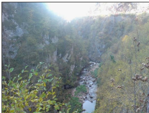
Sl. 2. U kanjonastim riječnim dolinama u slivu Krivaje formira se topoklima sa modificovanim klimatskim elementima u odnosu na osnovni klimatski tip. Objšnjenje u tekstu.

Sve ovo uslovalo je posebno baričko stanje sa orijentacijom od doline Džamijskog potoka prema njegovom završetku na otvorenoj površini. U takvim uvjetima nastala je advekcija ohlađenijeg zraka za oko 8,6°C i vlažnijeg za 39% iz uske doline prema prema otvorenoj površini. Strujni zrak je dosta svježiji zbog pojave termičkih razlika, koje su izazvale promjenu drugih meteoroloških parametara, posebno vlažnosti i zračnog pritiska.