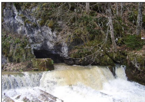
Sl. 3. Izvor rijeke Orlje. Na njegovom izvoru temperatura vode prosječno iznosi 4,5°C, a zraka 7°C. Tokom ljeta iz njega vjetri svjež zrak.

Upravne pošumljne duboke doline sjevernih ekspozicija zbog kraćeg zagrijavanja njihove podloge tokom dana imaju ohlađeniji zrak u odnosu na otvorene prostore. Razlika u temperaturama prizemnog zraka su evidentne zbog čega se uspostavlja nagnuto izobarsko stanje iz doline prema otvorenom pa time i ugrijanijim površinama. Zbog toga zrak vjetri iz doline prema njenom završetku donoseći obilje svježine. Ovo stanje se uspostavlja samo u toplijem periodu godine za vrijeme vrućih ljetnih dana. Doline iz kojih vjetri hladan zrak zovu se vjetrenice.