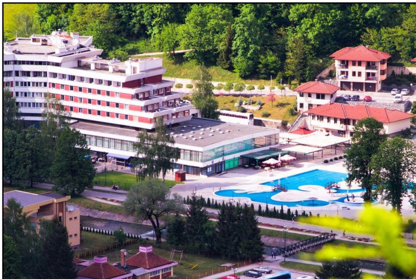
Sl. 1. Banja Reumal u Fojnici Fig. 1. Spa Reumal in Fojnica

U periodu od 2006. do 2013. godine broj noćenja u Reumalu je varirao od približno 139 hiljada 2012. godine, do rekordnih, gotovo 164 hiljade, 2008. godine. U analiziranom periodu u banjnskom-kompleksu Reumal ostvareno je 149.018 noćenja, što je daleko više od bilo kojeg drugog sličnog kompleksa u Bosni i Hercegovini. Primjera radi, banja Vrućica – Teslić, koja ima gotovo 900 ležaja, nalazi se na drugom mjestu po ostvarenim noćenjima u Bosni i Hercegovini sa manje od 115 hiljada noćenja u prosjeku. To je u odnosu na Reumal manje za preko 34 hiljade ostvarenih noćenja. Kao egzemplar može poslužiti i poznata banja Aquaterm u Olovu sa, u prosjeku, ostvarenih 26 hiljada noćenja. Drugim riječima, turistički promet Reumala petostruko je veći od turističkog prometa Aquaterma u Olovu.