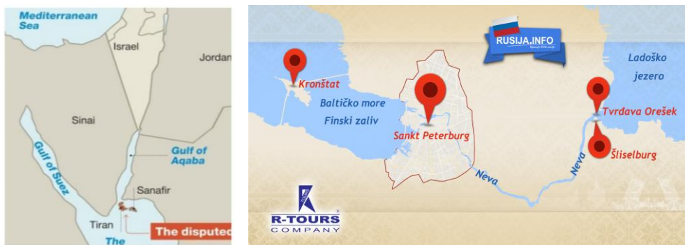
Sl. 6. Zaliv Aqaba koji je dug 160 km, a širok oko 24 km, grad Eilat (Izrael) dobio je izlaz na otvoreno more (slika lijevo) i Položaj Sankt Petesburga prema otvorenom moru između Finske i Estonije Fig. 6. Aqaba bay with length of 160 km, and width of cca 24 km, city of Eilat (Israel) got exit to the open sea (image left) and Position of Sankt Petesburg to the open sea between finland and Estonia.

Pridržavajući se odredaba Konvencije o pravu mora mnoge zemlje su riješile pitanja prava izlaska na otvoreno more. Za ilustraciju navedimo nekoliko svjetskih primjera: Na dnu zaliva Aqaba, koji je dug 160 km i širok oko 24 km, grad Eilat (Izrael) dobio je izlaz na otvoreno more nakon što je zaliv proglašen međunarodnim vodama. Da bi se zadovoljile obje strane, rijeka Hudson između Kanade i SAD-a ima dvojni suverenitet. Kada bi se, naprimjer, primijenila logika hrvatskih zvaničnika i nedorečenost bosanskohercegovačke politike, onda bi Ruska Federacija na Baltičkom moru ostala bez pristupa otvorenim vodama. Primjena Konvencije Ujedinjenih nacija o pravu na mora primjenjena je u skorašnjoj arbitraži oko Piranskog zaliva čije su zainteresirane strane bile R. Slovenija i R. Hrvatska u korist R. Slovenije.