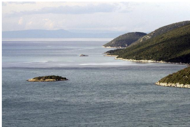
Sl. 5. Veliki i Mali školj u kanalu Malog Stona Fig. 5. Great and Small školj in the Mali Ston channel

nad kojima suverenitet ima Bosna i Hercegovina. Veliki školj, površine 7,6 dunuma, nalazi se uz jugoistočnu obalu poluotoka Klek na udaljenosti 175 m od obale. Veliki školj je najistureniji dio kopna u akvatorijalnom dijelu teritorije Bosne i Hercegovine. Mali Školj nalazi se neposredno uz obalu ima površinu 820 m 2 , a udaljen je 2,1 km od Velikog školja.