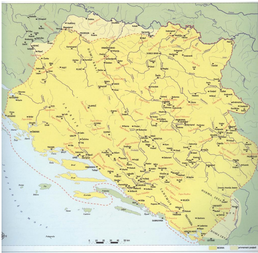
Sl. 1. Bosna i Hercegovina u vrijeme Tvrtka I Kotromanića (1353-1391)

Bosne – Horion; Bosnosa - zemljica Bosna, kako to često mnogi historičari, pa i oni najmlađi. Pored toga, pojam „horion“ preuzet iz grčkog jezika i u prijevodu nije deminutiv državnog teritorija – zamljica, već je to geografski pojam za državnu cjelinu, teritorij, prostor, zemlju, geografsku regiju, kraj, predio, oblast.