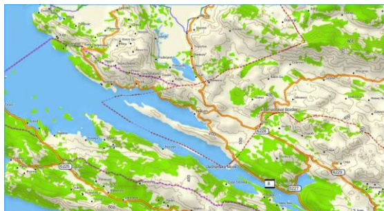
Sl. 7. Parafirana granica na moru od strane predsjednika R. Hrvatske Franje Tuđmana i člana predsjedništva Bosne i Hercegovine Alije Izetbegovića pravim linijama zatvara izlaz Bosni i Hercegovini na otvoreno more. U gornjem lijevom uglu slike crvenom linijom je označen pravac u slučaju gradnje Pelješkog mosta, koji bi trajno onemogućio izlaz na otvoreno more.

Fig. 7. The promised border at sea by the President of Republic of Croatia Franjo Tuđman and a member of the presidency of Bosnia and Herzegovina Alija Izetbegović closes the lines of Bosnia and Herzegovina on the open sea. In the upper left corner of the picture, the red line is a direction for the construction of the Peljesac Bridge, which would permanently disable the open sea exit.