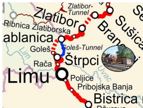
Sl. 3. Segment pruge Beograd – Bar u Bosni i Hercegovini na lokalitetu Štrpci.

Slični problemi su u naselju Ustibar sa lijeve strane rijeke Lim iako teritorijalno pripadaju Bosni i Hercegovini njihovi mještani uslužne djelatnosti nalaze u bližim mjestima kao što je Priboj u R. Srbiji u odnosu na naša udaljenija u Višegradu, Goraždu ili Foči. Navedene enklave obuhvataju oko 40 km 2 na kojima živi oko 1 500 stanovnika. Zahtjevi R. Srbije da se ovi prostori pripoje njenoj strani su u osnovi nerealni, po izjavama čelnih predstavnika vlasti u općini Rudo koji navode da se radi o prirodnogeografskim i infrastrukturnim vrijednim područjima, koji su zvanično topografski i kartografski evidentirani u Bosni i Hercegovini.