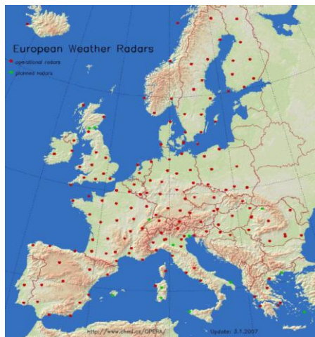
Sl. 1. Geografska raspodjela meteorološke radarske službe u zemljama Evropske Unije Fig. 1. Geographical distribution of meteorological radar service in European Union member states

tizacija, je od posebnog značaja kod manjih vodotoka gdje, zbog dosta brzog formiranja poplavnih talasa, ostaje kratak vremenski period za preduzimanje ostalih aktivnosti na odbrani od poplava. Automatizovani hidrološki i meteorološki monitoring omogućuje prognozu visine i plavljenja riječnih poloja poplavnim talasima.