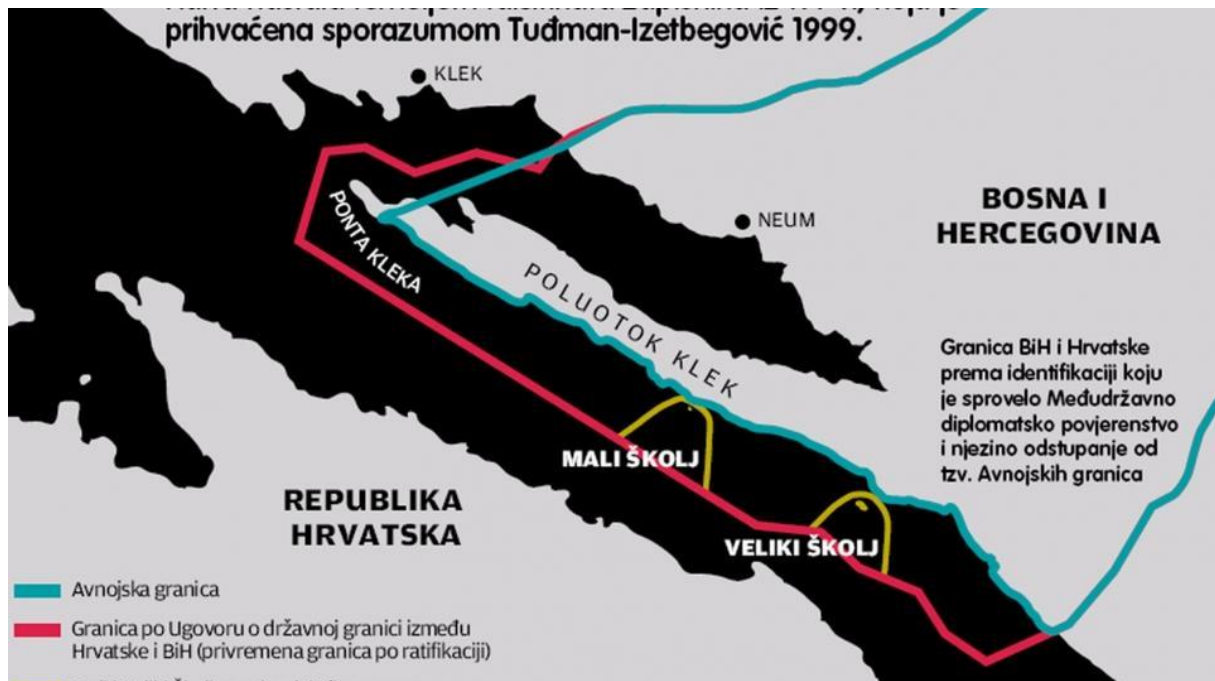
Sl. 3. Sporazumna morska granica Tuđman – Izetbegović, koja nikada nije ratificirana

Prethodno morsko razgraničenje, koje je jedino opravdano, dat će odgovore na brojna pitanja mogućnosti planirane izgradnje. Ukoliko bi Pelješki most bio izgrađen prije morskog razgraničenja mogao bi limitirati pregovore sa R. Hrvatskom o izlasku Bosne i Hercegovine na otvoreno more, ugroziti njen suverenitet na moru, isključiti je iz asocijacije pomorskih zemalja, ugroziti suverenitet nad našim školjevima pa time i pravo na unutrašnje more u Malostonskom kanalu prema poluotoku Pelješac.