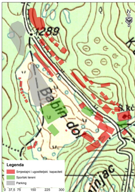
Karta 2: Reambulacija segmenta topografske karte BjelašnicaIstok

značajan nesklad. Naime, navedena karta datira iz 1974. godine, nakon čega je područje Babinog dola predviđeno za izgradnju skijaških staza i pratećih infrastrukturnih objekata, u svrhu organizacije XIV Zimskih olimpijskih igara održanih 1984. godine u Sarajevu. Neposredno prije održavanja ZOI 1984. izgrađena su skijališta i hotel „Maršal“, dok je u posljednjoj deceniji izgrađeno apartmansko naselje, te veći broj ugostiteljskih kapaciteta. Iz priložene Karte 2. na kojoj su u digitalnoj formi unešene sve značajne promjene u prostoru, može se uočiti u kojoj mjeri je navedeno područje antropogenizirano, što ukazuje na potrebu za nužnom reambulacijom zastarjelih topografskih karata.