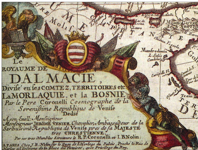
Sl. 4. Kartuška Coronellijeve i Nolinove karte kraljevine Dalmacije, 1690, faksimil

Fig.4. Cartridge of the Coronelli's and Nolin's map of the Kingdom of Dalmatia, 1690, facsimil