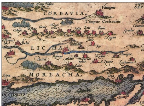
Sl. 2. Isječak Bonifačićeve karte okolice Zadra i Šibenika s regijama Morlakije, Like i Krbave, 1573, faksimil. Fig. 2. Bonifačić's Map of the surroundings of Zadar and Šibenik with the region of Morlacha, Licha and Corbavia, section, 1573, facsimile