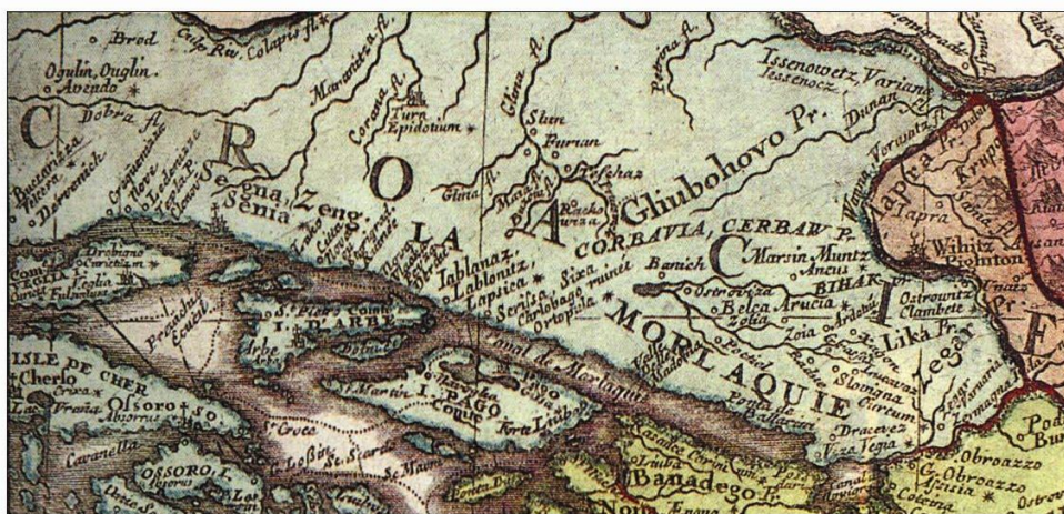
Fig. 3. Representation of Croatia and the region of Morlaquie on the Coronelli's and Nolin's map, section, 1690, facsimil

Slika Vlaha kao “Drugih” može se jasno iščitati na karti Hrvatske P.R. Vitezovića 3 (1699) (Sl. 5.) i karti Slavonije G.C. da Vignole 4 (1690) (Sl.6). Vitezovićev tekst koji je unio duž granice: Terra deserta olim nunc a Valachis habitata (nekad pusta zemlja, sada nastanjena Vlasima) ukazuje da se Vlasi smatraju “Drugima” u smislu društvene i religijske diferencijacije (Fuerst-Bjeliš i Zupanc, 2007a; Fuerst-Bjeliš, 2011).