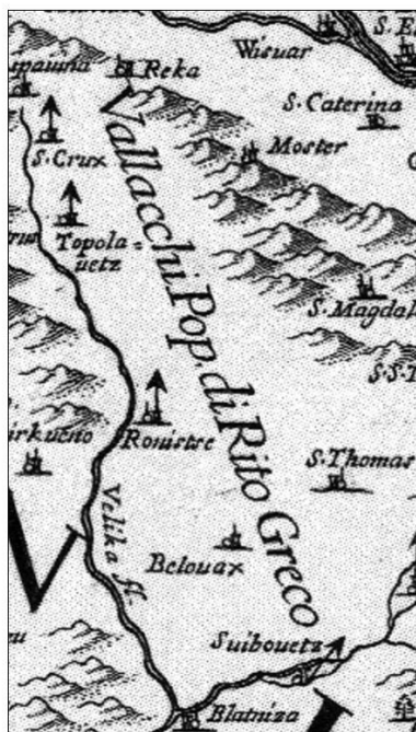
Sl.6. Isječak Karte Slavonije G.C. da Vignole, 1690, faksimil Fig.6. Da Vignola's map of Slavonia, section, 1690, facsimile