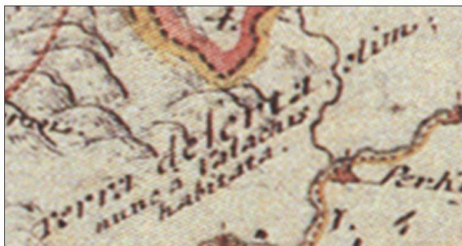
Sl. 5. Isječak karte hrvatskog kraljevstva P.R. Vitezovića, 1699, faksimil. Fig. 5. Vitezović's Map of the whole Kingdom of Croatia, section, 1699, facsimile