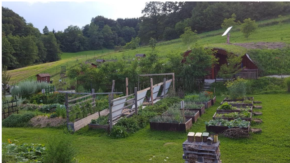
Sl. 1. Agroekologija na Edukacijskom poligonu Dole, Slovenija

ma da osjete koncept samoodrživosti. S druge strane u istraživanju i praksi različitih agroekoloških i ekoremediteracionih tehnika, koje su po svojoj prirodi dijelom transdisciplinarne uslijed uključivanja različitih društvenih aktera i saradnjom sa lokalnom zajednicom.